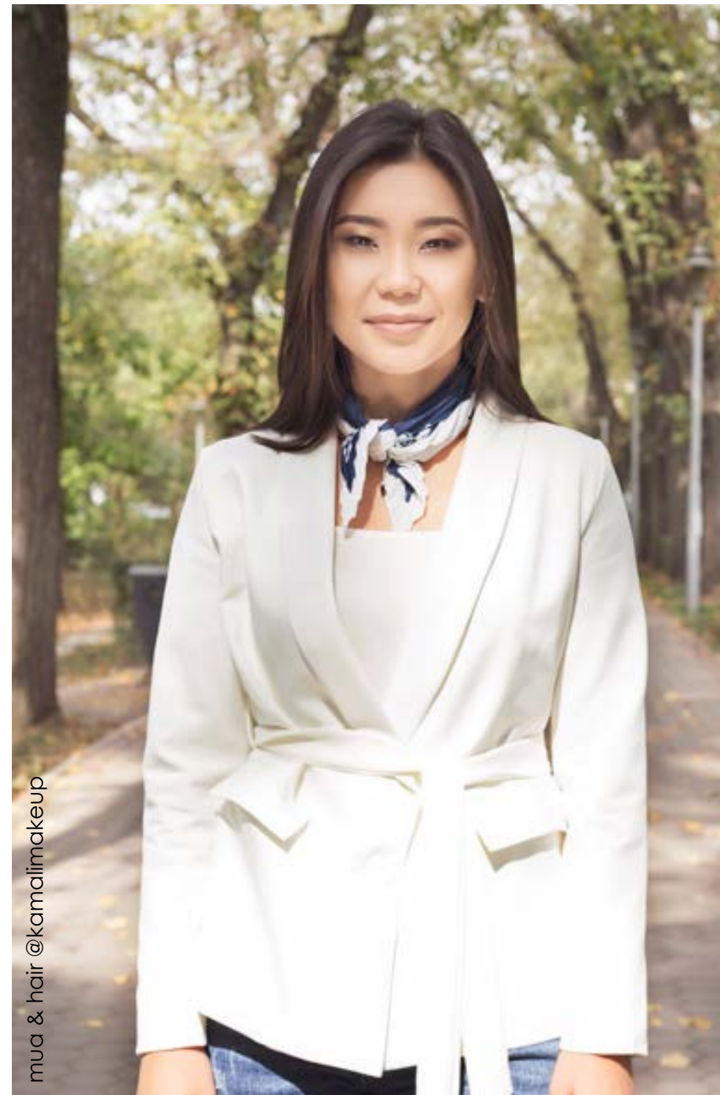
mua & hair @kamalimakeup

каждому празднику индивидуально и всегда рады провести интересное и яркое торжество. Также уникальна и наша лучшая команда, которая с радостью подарит каждому ребенку частичку сказки, радости и волшебства!