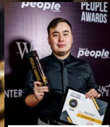
Куан Лекеров @kuan_lekerov