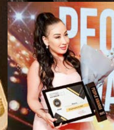
Студия красоты Rihanna @rihanna_studio_kz