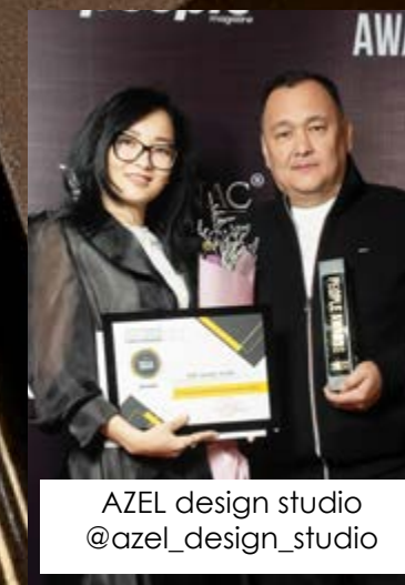
AZEL design studio @azel_design_studio