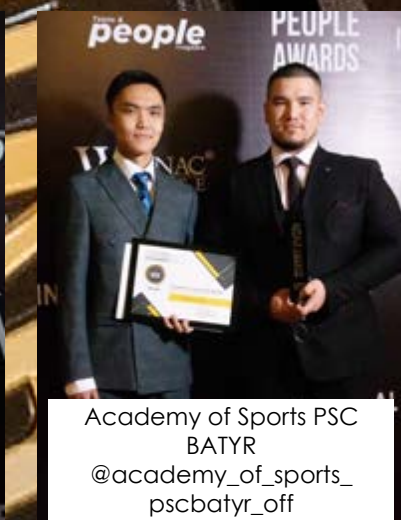
Academy of Sports PSC BATYR @academy_of_sports_pscbatyr_off