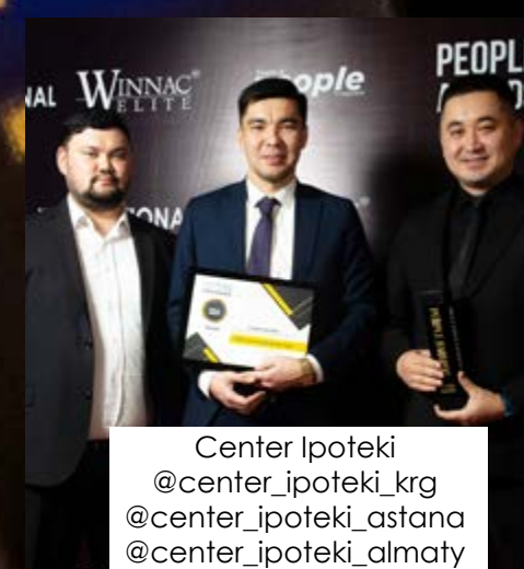
Center Ipoteki @center_ipoteki_krg @center_ipoteki_astana @center_ipoteki_almaty