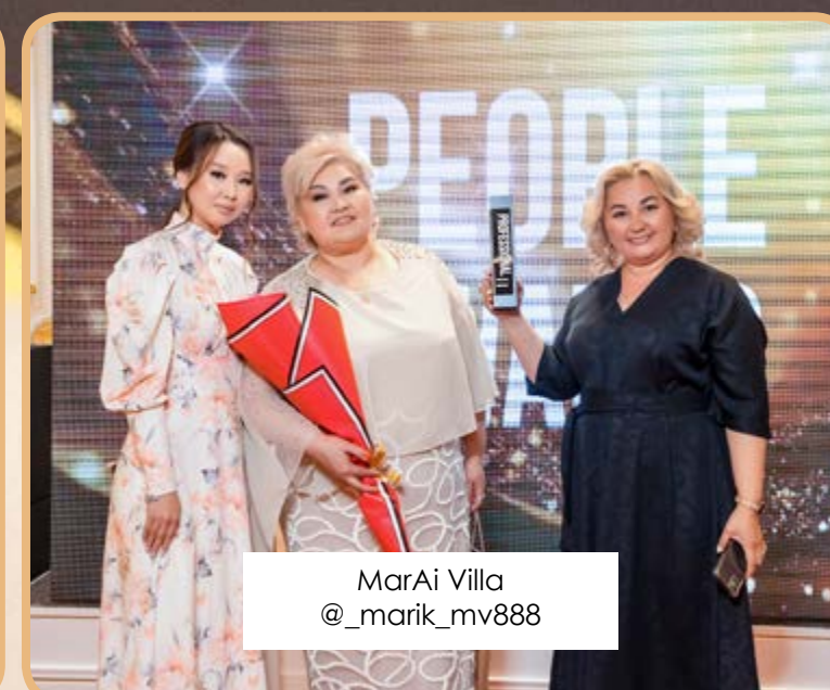
MarAi Villa @_marik_mv888