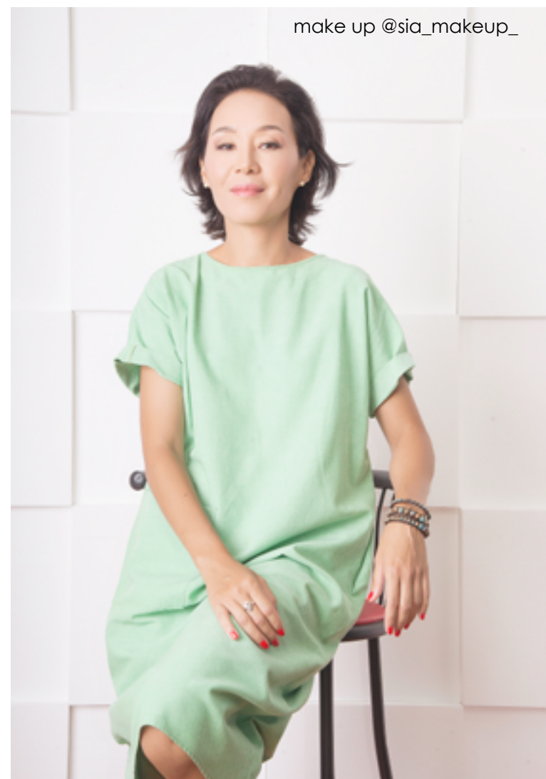
make up @sia_makeup_

– В большинстве своем это молодежь 24–28 лет. И меня очень радует, что, будучи в таком молодом возрасте, люди уже готовы осознать многие вещи и принять мудрые решения. Во всяком случае, мне попадаются именно такие. Основное желание – это взглянуть на себя как бы со стороны, узнать свои слабые и сильные стороны, понять себя: в каком направлении двигаться, по какой энергии, чтобы вывести себя в плюс, где себя лучше проявить и т.д. Сейчас я запускаю акцию для родителей детей с особенностями в развитии (аутизмом, синдромом Дауна, ДЦП и т.п.). С сентября начну давать консультации по определенным дням для таких родителей. Стоимость консультаций для них символическая. Как мама ребенка с РАС, я хорошо понимаю, сколько сил и затрат уходит на реабилитацию наших детей, и очень многие не могут финансово позво-