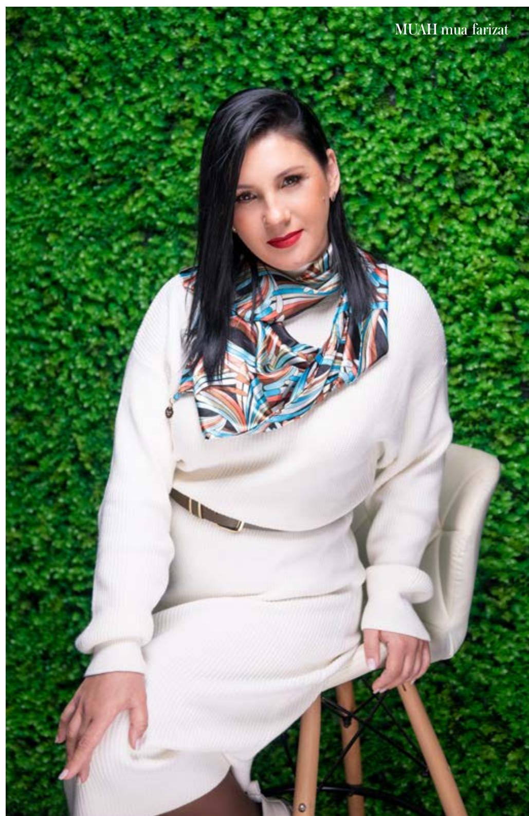
MUAH mua farizat

Каждый мой новый проект отражает, прежде всего, огромную любовь к моему делу. И я чувствую искреннюю радость, когда заказчик остается доволен и счастлив.